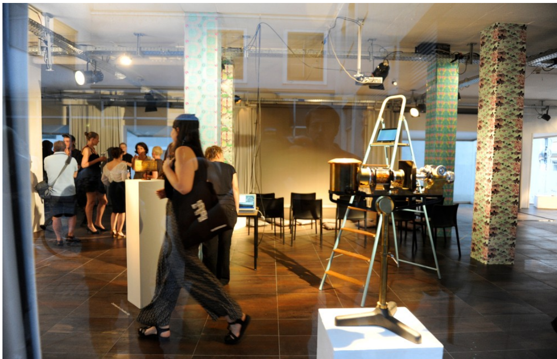
SUBLIM by Daily Rhythms Collective (2016)