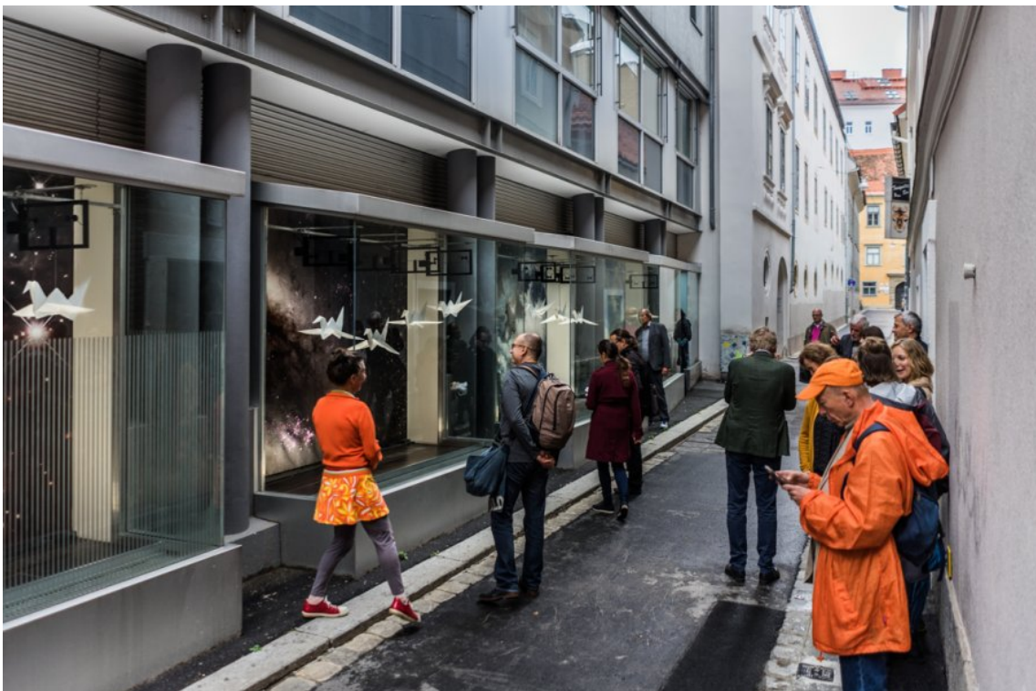
Distant Skies:Pressure Waves by Kathy Hinde (2019)